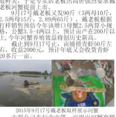
2015年9月17日戴老板展示河蟹