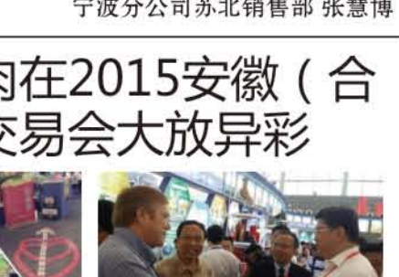
左右为左腮腮36白面的成长料